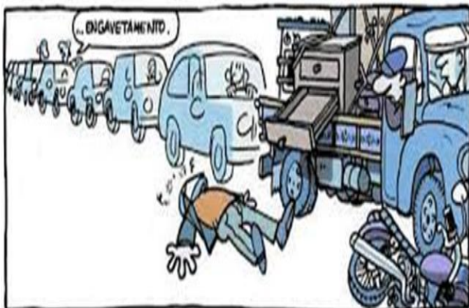
LAIBIRTI. Clássicafe, livro 2. São Paulo: Devir, 2002, p. 13.